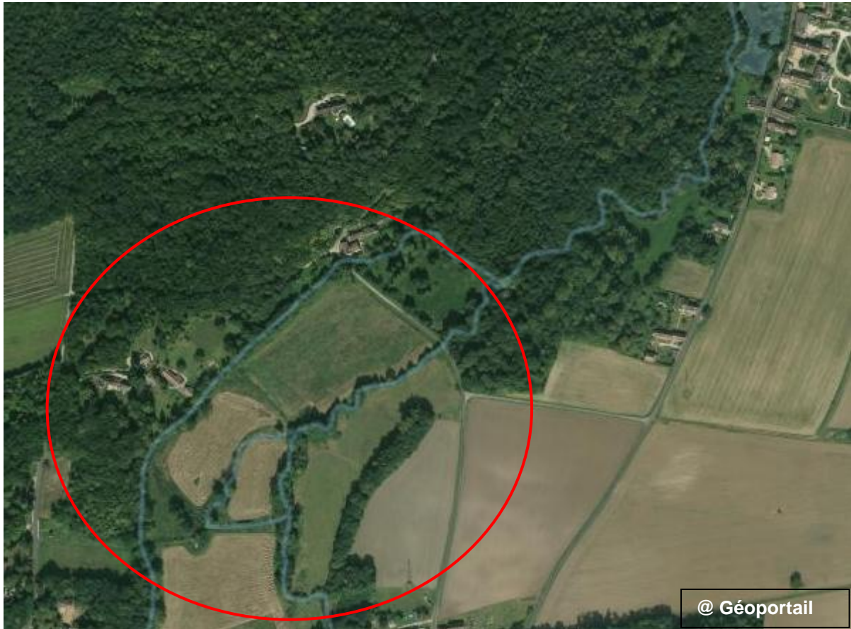
Figure 2 Photographie aérienne du site